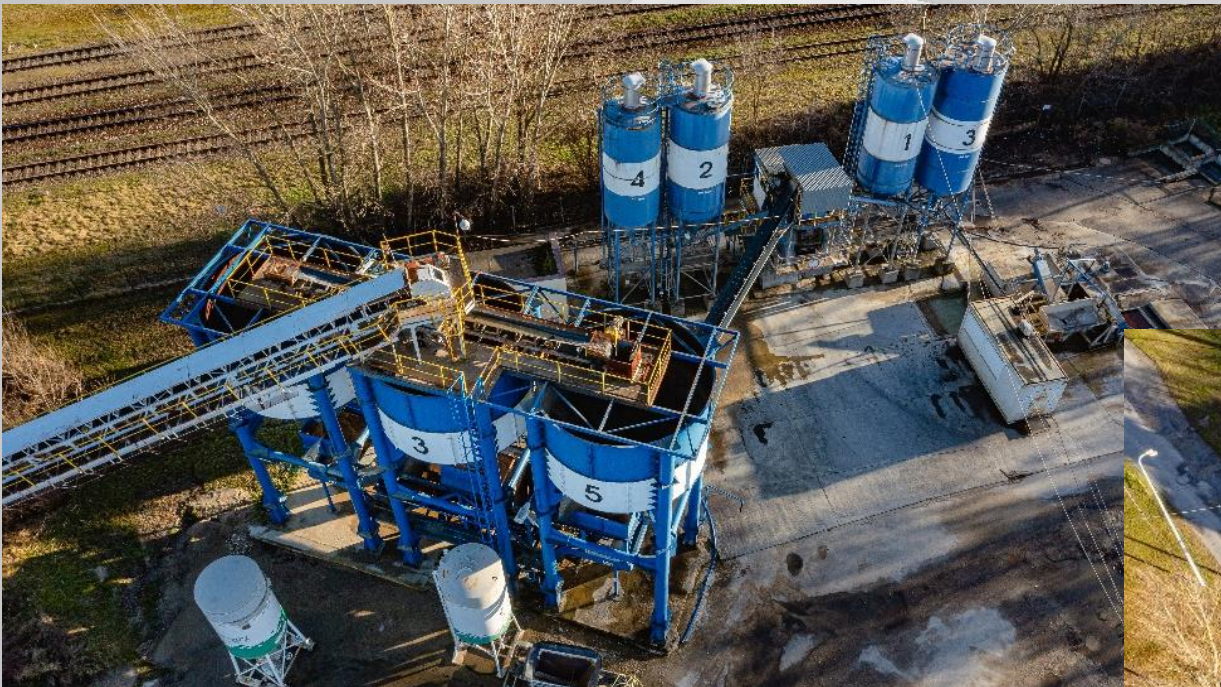
Betonárna typu ELBA EMC-60