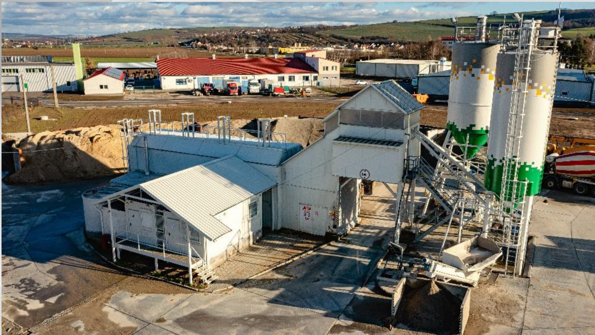
Betonárna typ STASIS s hodinovým výkonem 50 m 3 čerstvého betonu